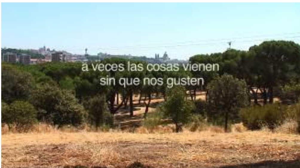
Miquel García, PROSTITUCIÓN. Prácticas relacionales en peligro de extinción , Vídeo, 2011

En el 2012, el SCREEN festival se estructura según los siguientes componentes: Sección Oficial, feria LOOP, SCREEN forum Pro, Galerías de Barcelona, miniSCREEN, Proyecto Universidades y citySCREEN.